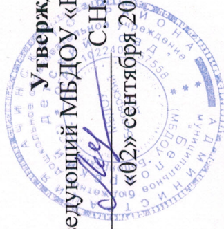
ГРАФИК РАБОТЫ КОНСУЛЬТАТИВНОГО ПУНКТА «Мы Вместе»