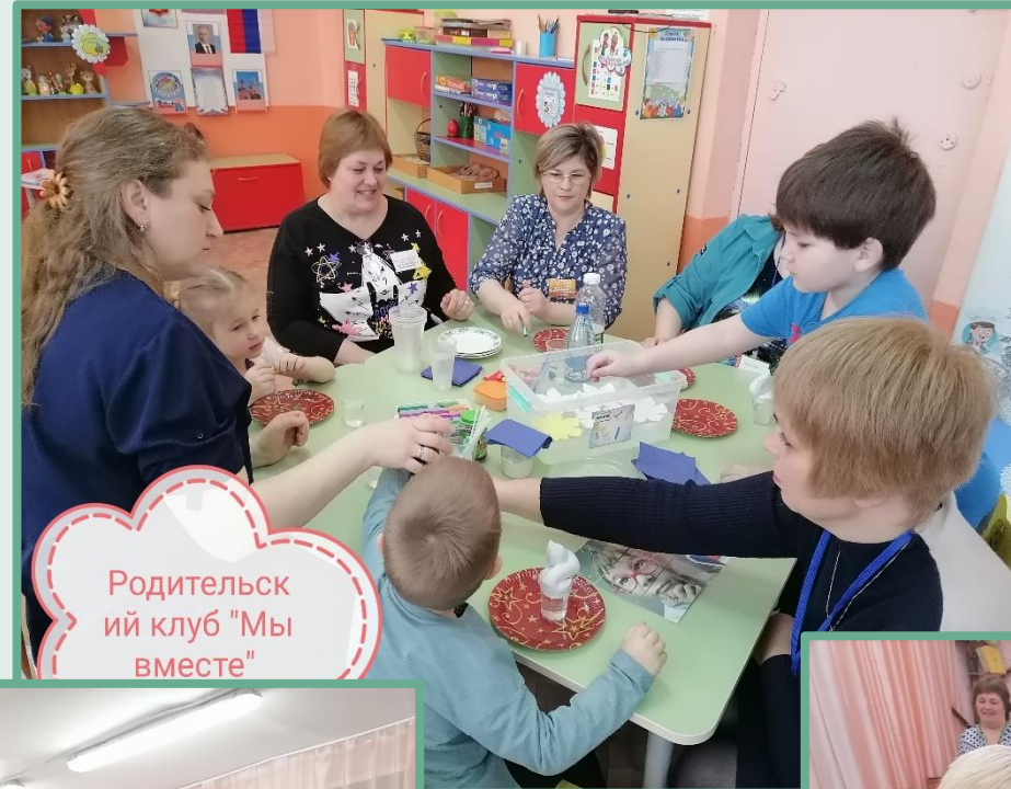
Родительский клуб "Мы вместе"